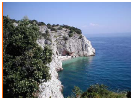
Una suggestiva immagine di Brsec (HR)

Carissimi amici, con questa rivista che tratterà principalmente argomenti d'interesse per i soci della Società "NETTUNO", vorrei dare inizio ad un nuovo metodo di comunicazione tra i quanti sono regolarmente iscritti. Premesso che l'iniziativa è tutt'altro che facile da portare avanti, sia per i costi che per il tempo che questa richiede, desidero sottolineare che la partecipazione per quanto concerne la trattazione di argomenti è assolutamente aperta a tutti i soci e a quanti con la loro stima verso il nostro gruppo, pur non iscritti, desiderino esprimere le loro conoscenze. Ma la rivista non sarà solo un